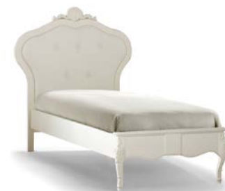
Art. 1028T Letto una piazza Single Bed 131 x 215 x 149H