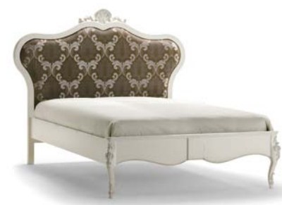
Art. 1040T Letto una piazza e mezza French Sized Double Bed 181 x 215 x 149H