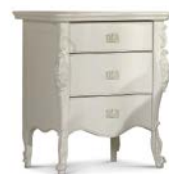
Art. 1029T Comodino Night Table 56 x 41 x 68H