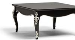
Art. 1013T Tavolino da salotto quadrato Square Coffee Table 90 x 90 x 48H