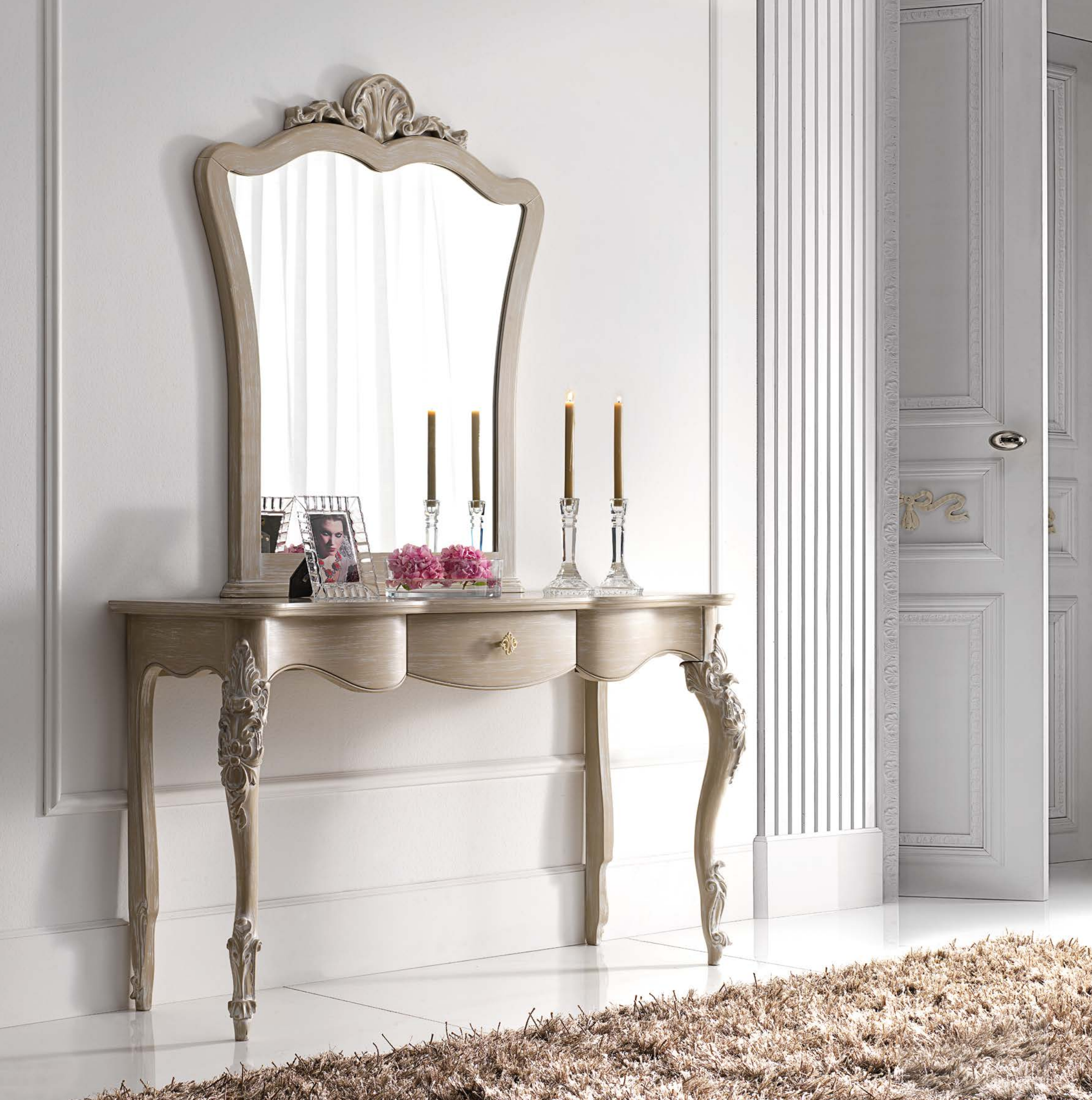
Art. 1014T - Consolle / Console - 142 x 46 x 83H