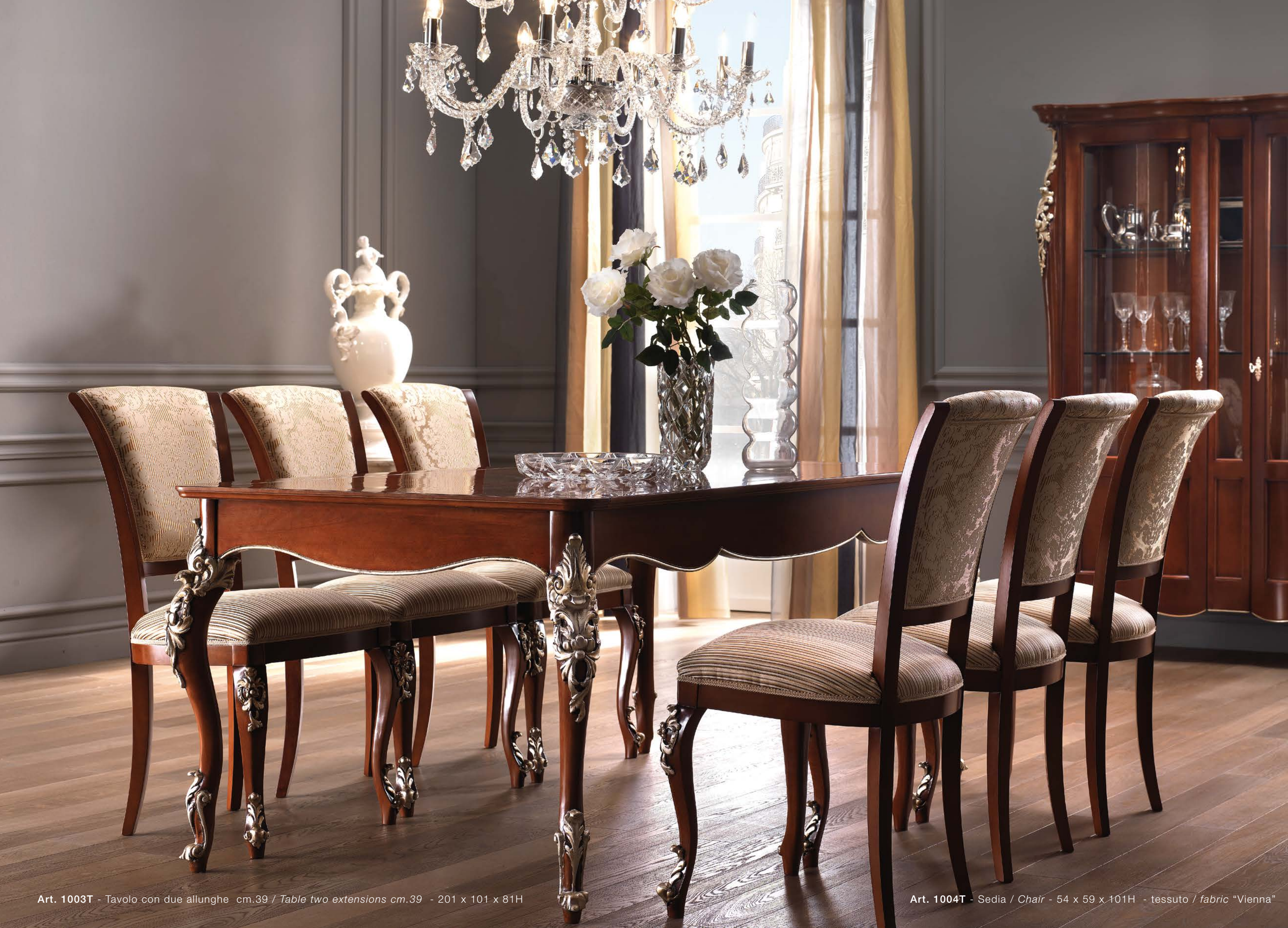
Art. 1003T - Tavolo con due allunghes cm.39 / Table two extensions cm.39 - 201 x 101 x 81H