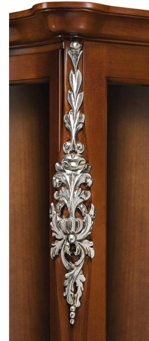
Noce + foglia argento