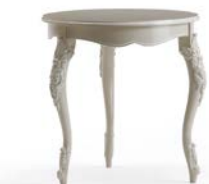
Art. 1069T Tavolino Coffee table cm.Ø 70 x 75H