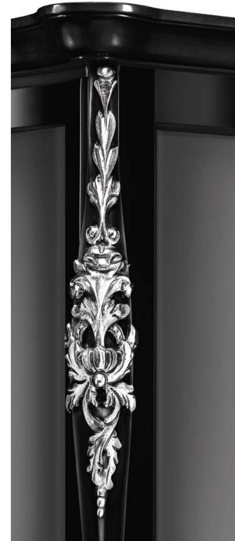
Nero + foglia argento