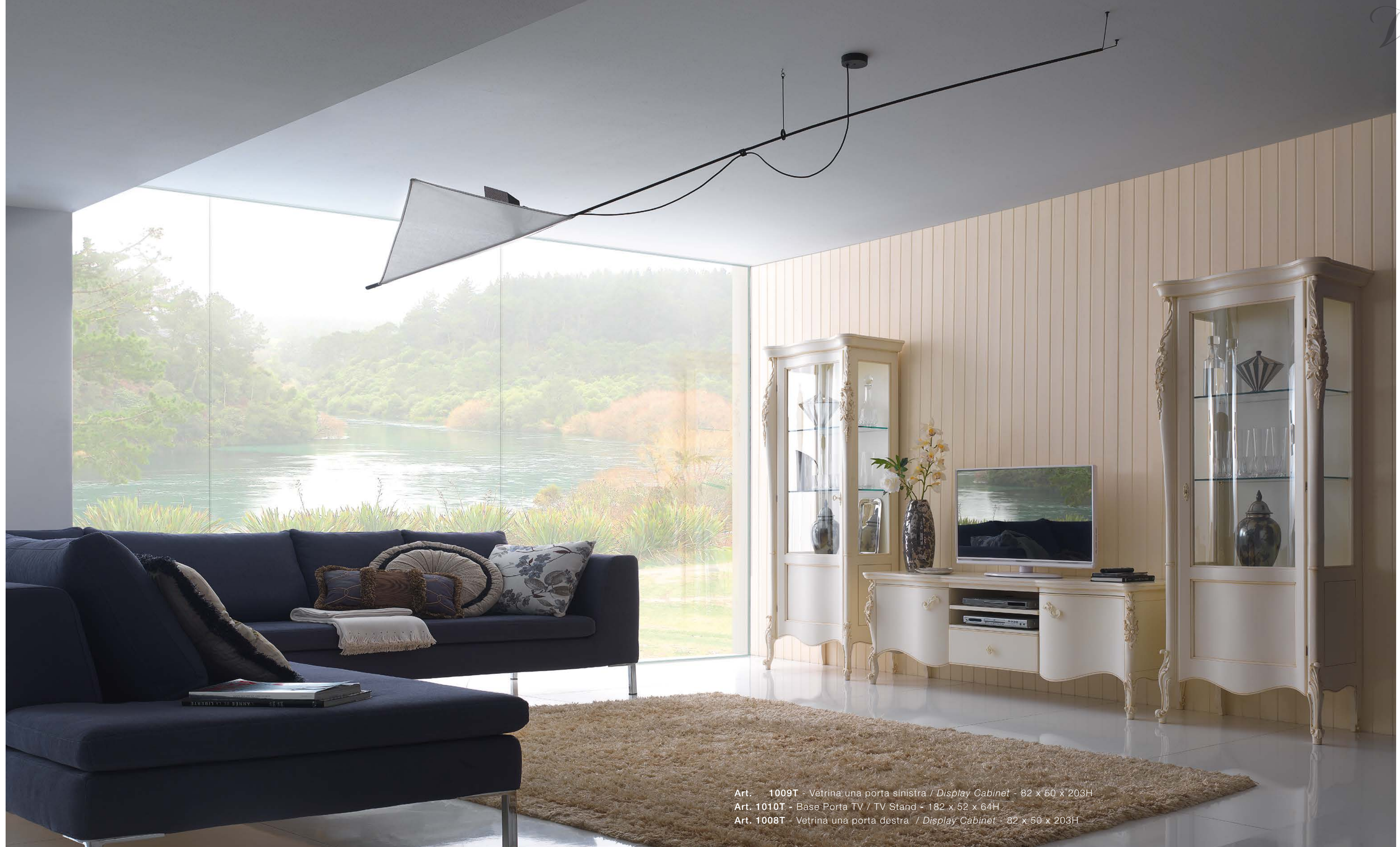
Art. 1009T - Vetrina una porta sinistra / Display Cabinet - 82 x 50 x 203H Art. 1010T - Base Porta TV / TV Stand - 182 x 52 x 64H Art. 1008T - Vetrina una porta destra / Display Cabinet - 82 x 50 x 203H