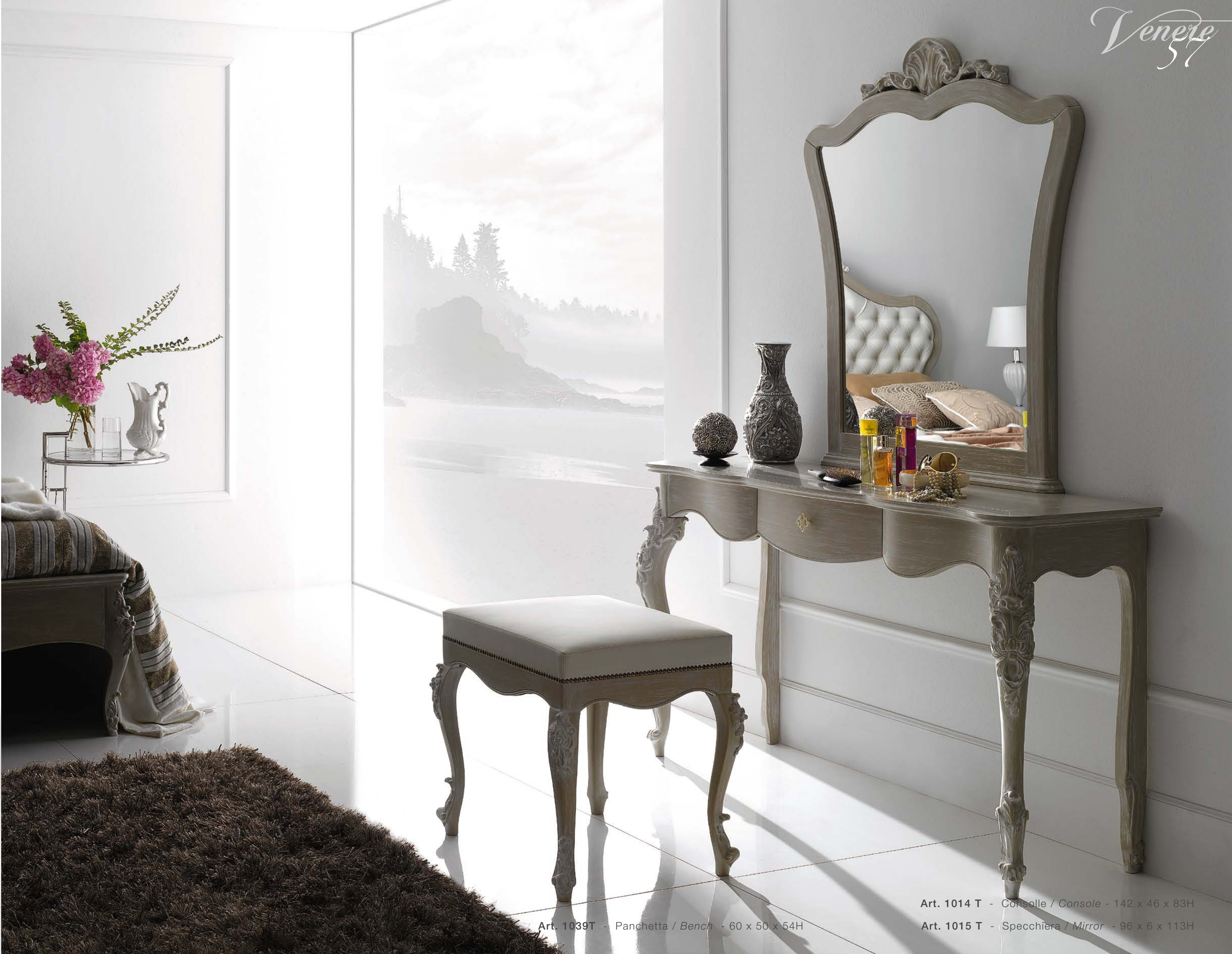
Art. 1039T - Panchetta / Bench - 60 x 50 x 54H