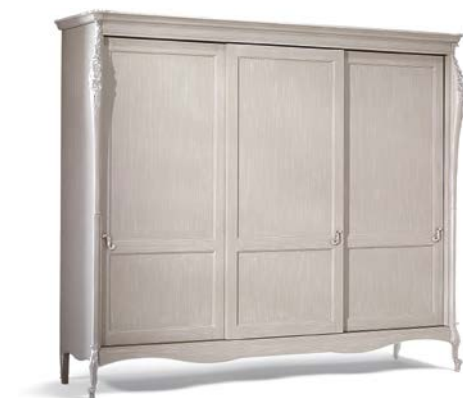
Art. 1030T Armadio tre Ante Scorrevoli Sliding 3-Door Wardrobe 300 x 69 x 250H