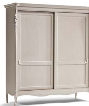
Art. 1037T Armadio 2 ante scorrevoli Sliding 2-Door Wardrobe 200 x 69 x 225H