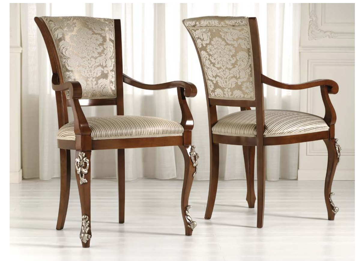
Art. 1005T - Sedia capotavola / Armchair - 64 x 62 x 101H - tessuto / fabric "Vienna"