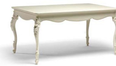
Art. 1007T Tavolo con 2 allunghe da cm. 39 Table with 2 extensions cm. 39 161 x 101 x 81H