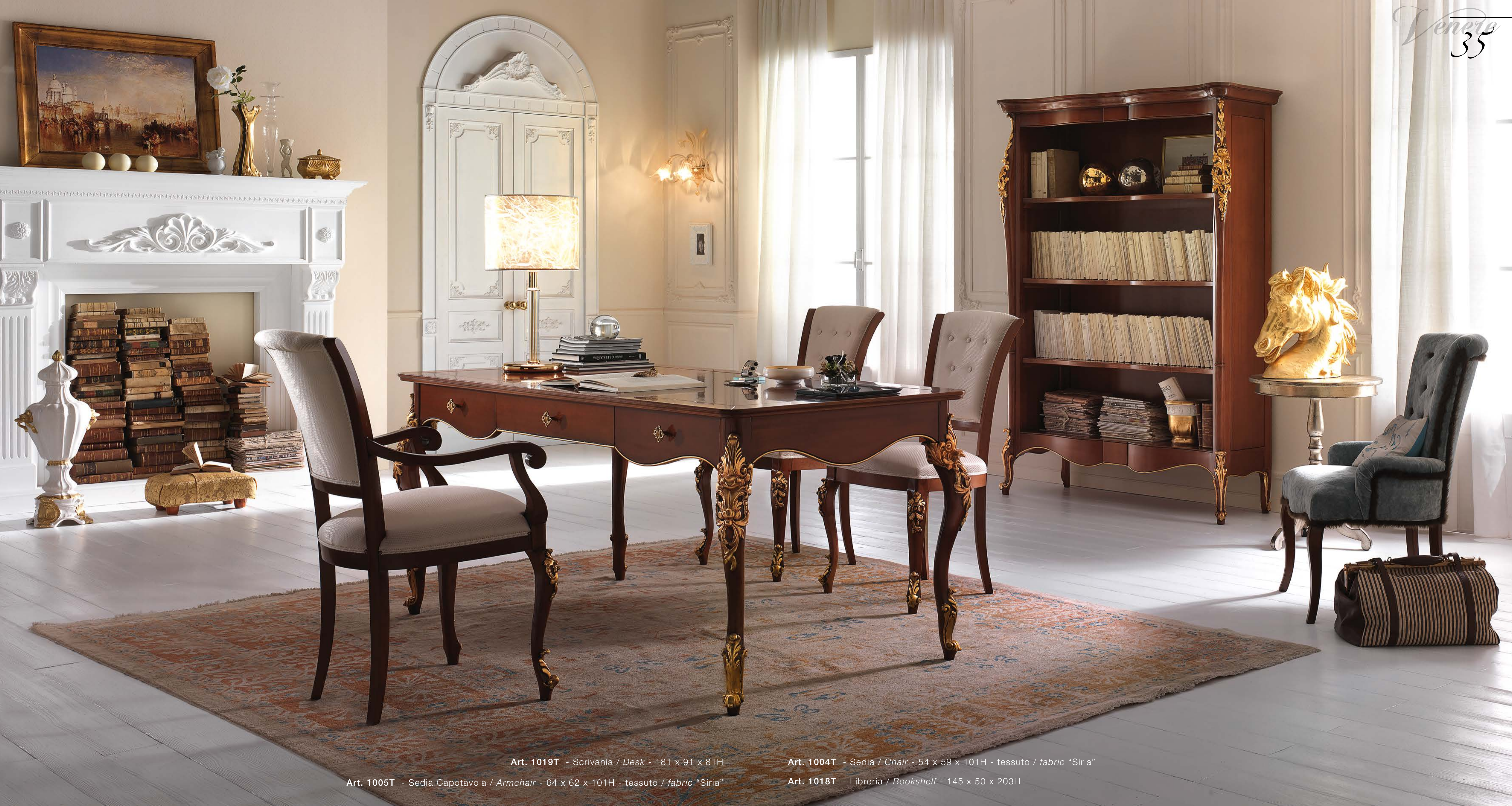
Art. 1019T - Scrivania / Desk - 181 x 91 x 81H