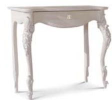
Art. 1023T Consolle Console 90 x 46 x 83H