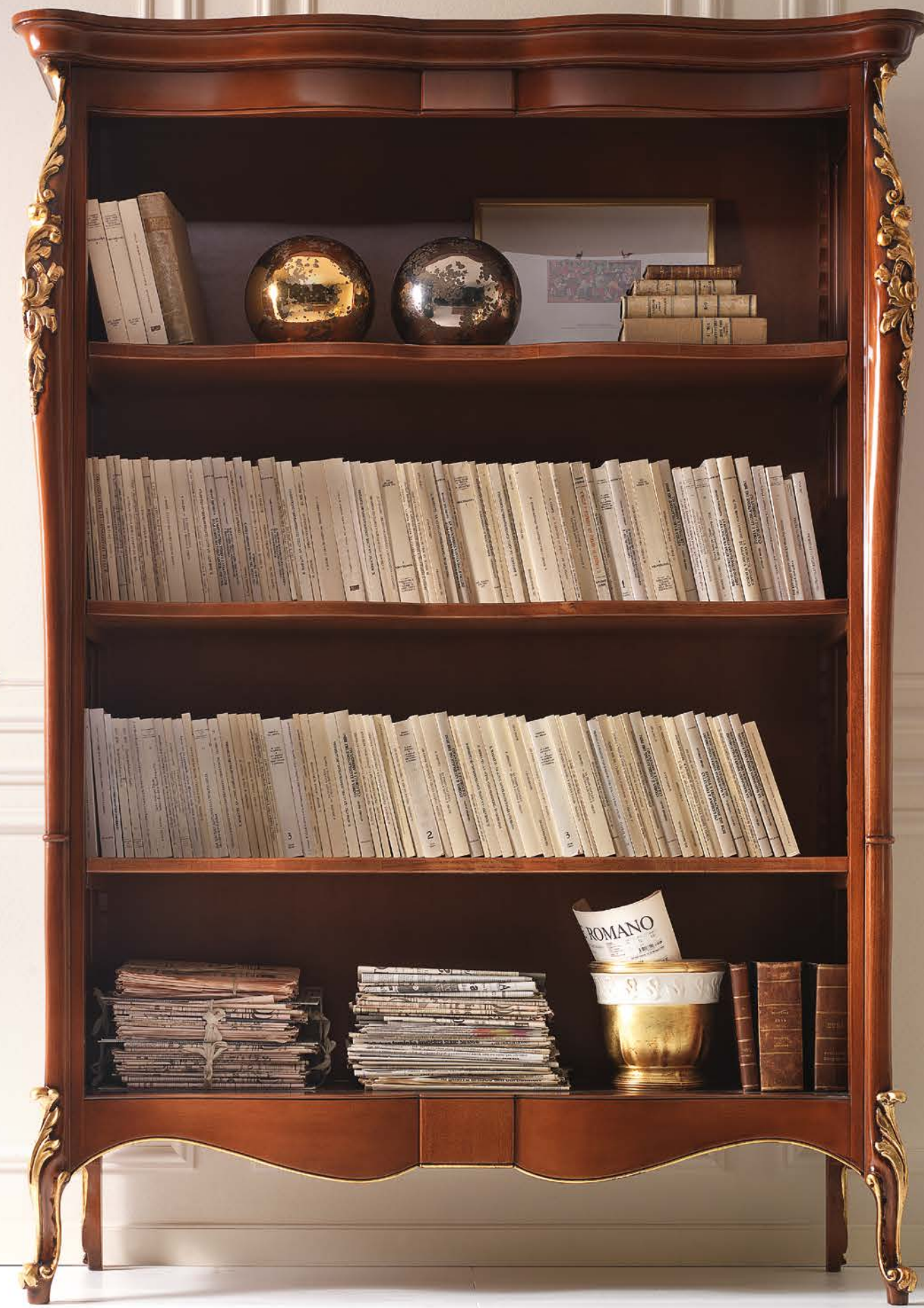
Art. 1018T - Libreria / Bookshelf - 145 x 50 x 203H