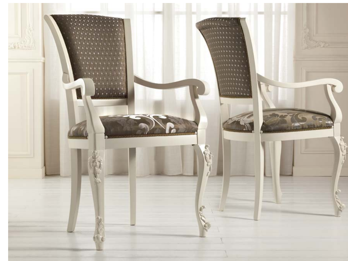
Art. 1005T - Sedia capotavola / Armchair - 64 x 62 x 101H - tessuto / fabric "Rubino"