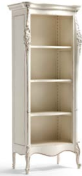
Art. 1020T Libreria Bookshelf 82 x 50 x 203H