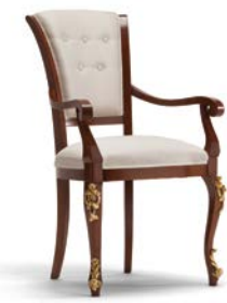
Art. 1005T Sedia Capotavola Armchair 64 x 62 x 101H tessuto "Siria" fabric "Siria"