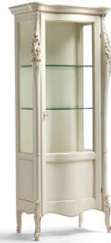
Art. 1008T Vetrina una porta destra One right door Display Cabinet 82 x 50 x 203H