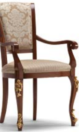
Art. 1005T Sedia Capotavola Armchair 64 x 62 x 101H tessuto "Vienna" fabric "Vienna"