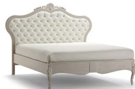
Art. 1038T Letto matrimoniale Bed 201 x 215 x 151H