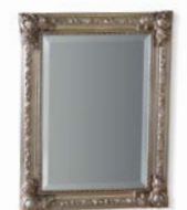
Art. 1024T Specchiera Mirror 60 x 7 x 80H