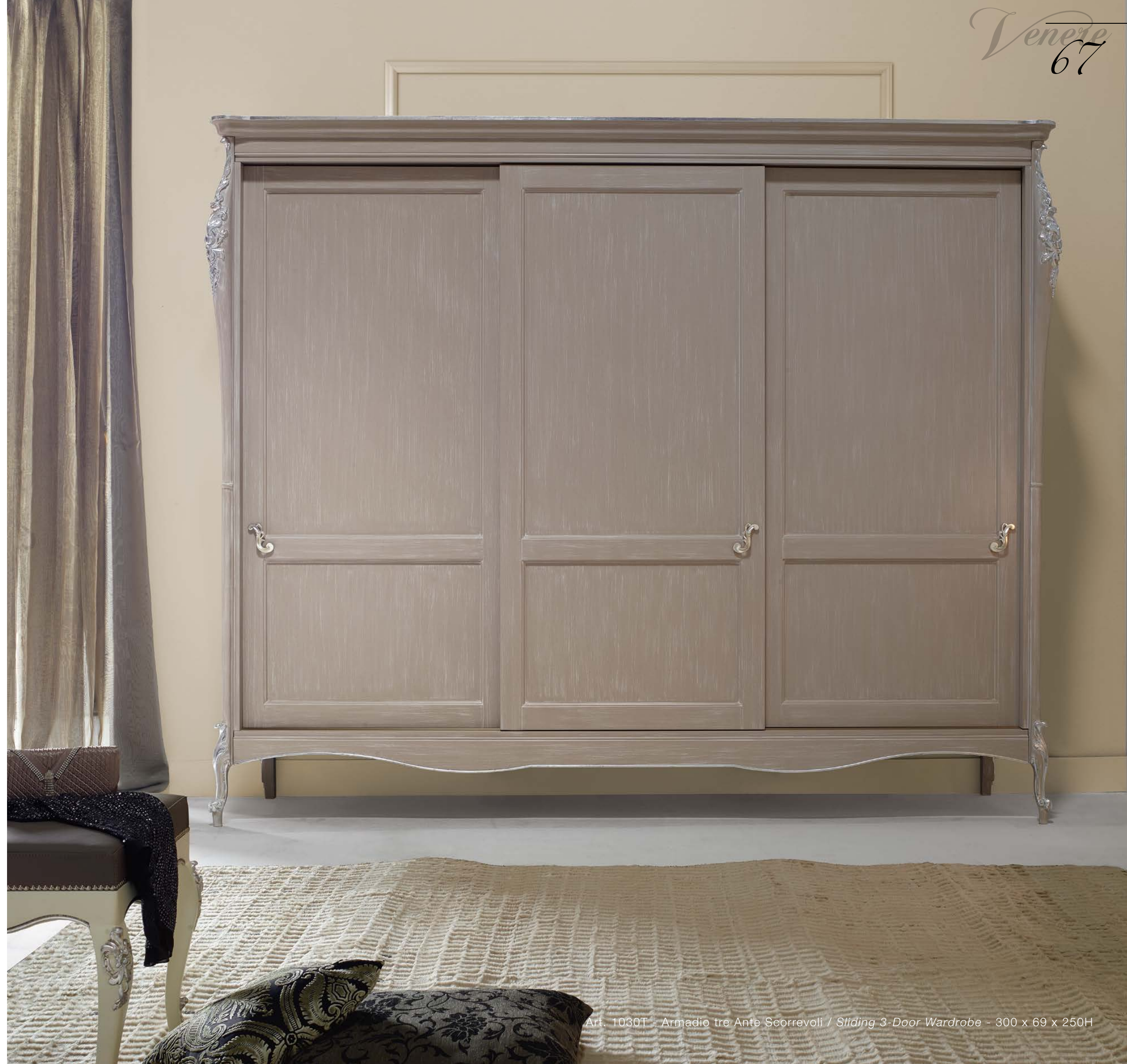
Art. 1030T - Armadio tre Ante Scorrevoli / Sliding 3-Door Wardrobe - 300 x 69 x 250H