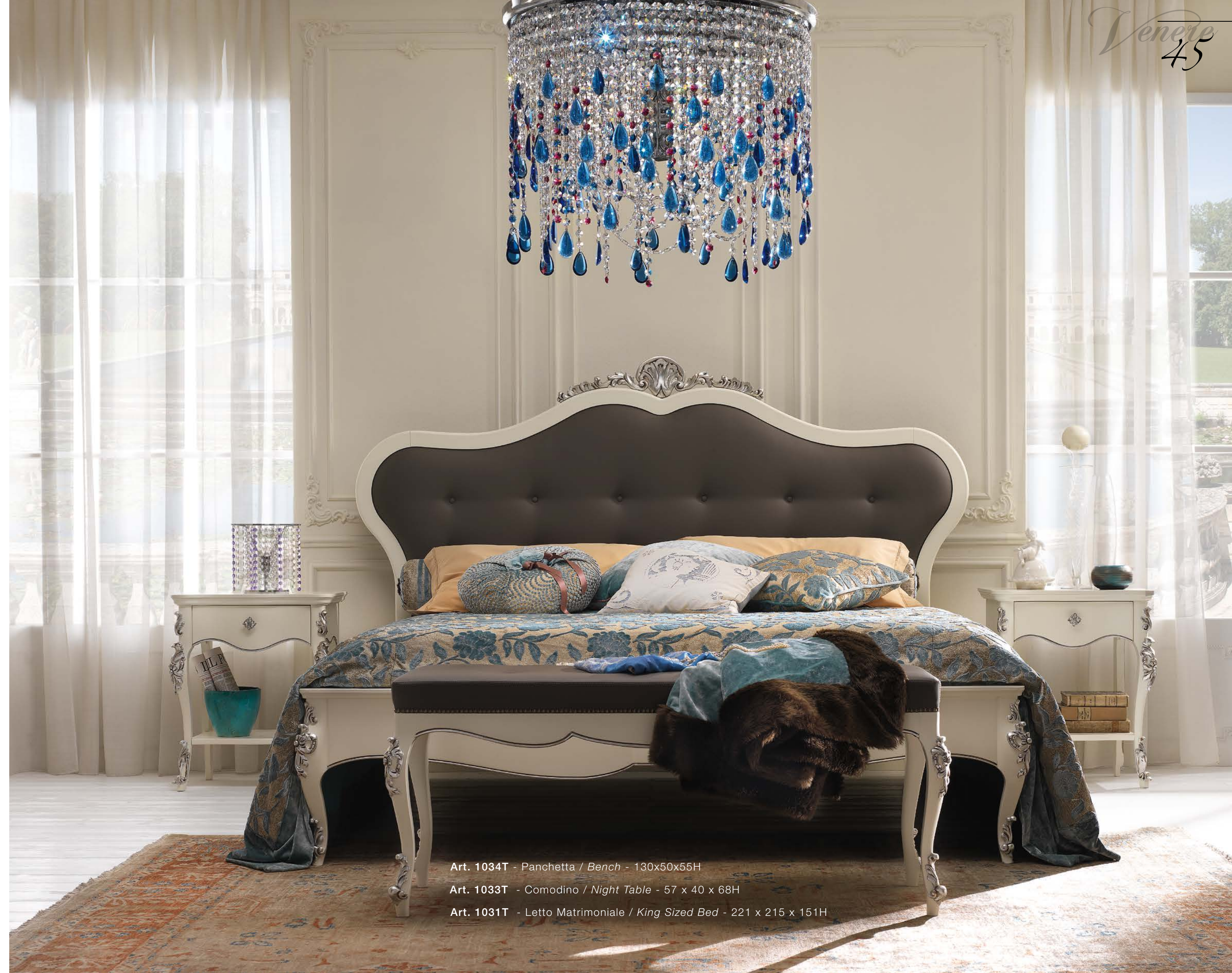
Art. 1034T - Panchetta / Bench - 130x50x55H