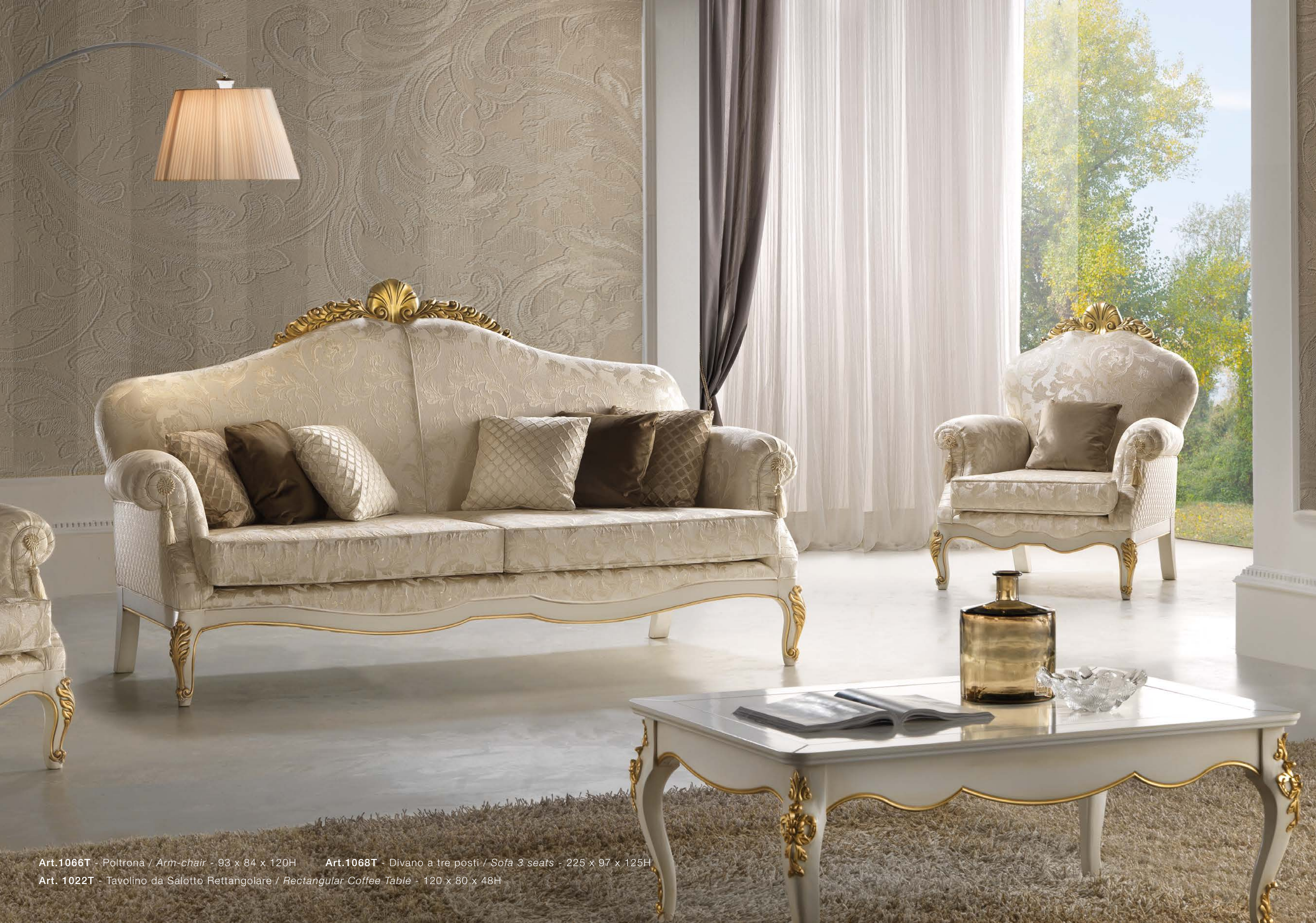
Art.1066T - Poltrona / Arm-chair - 93 x 84 x 120H Art.1068T - Divano a tre posti / Sofa 3 seats - 225 x 97 x 125H Art. 1022T - Tavolino da Salotto Rettangolare / Rectangular Coffee Table - 120 x 80 x 48H