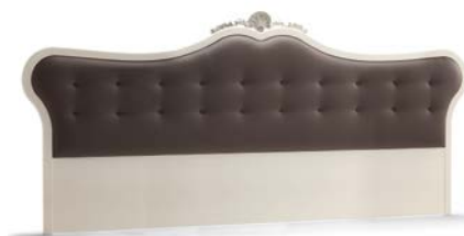
Art. 1043T Testiera letto Headboard 340 x 5 x 150H