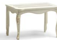
Art. 1044T Porta valigie Luggage Rest 78 x 47 x 51H