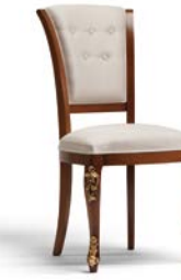
Art. 1004T Sedia Chair 54 x 59 x 101H tessuto "Siria" fabric "Siria"