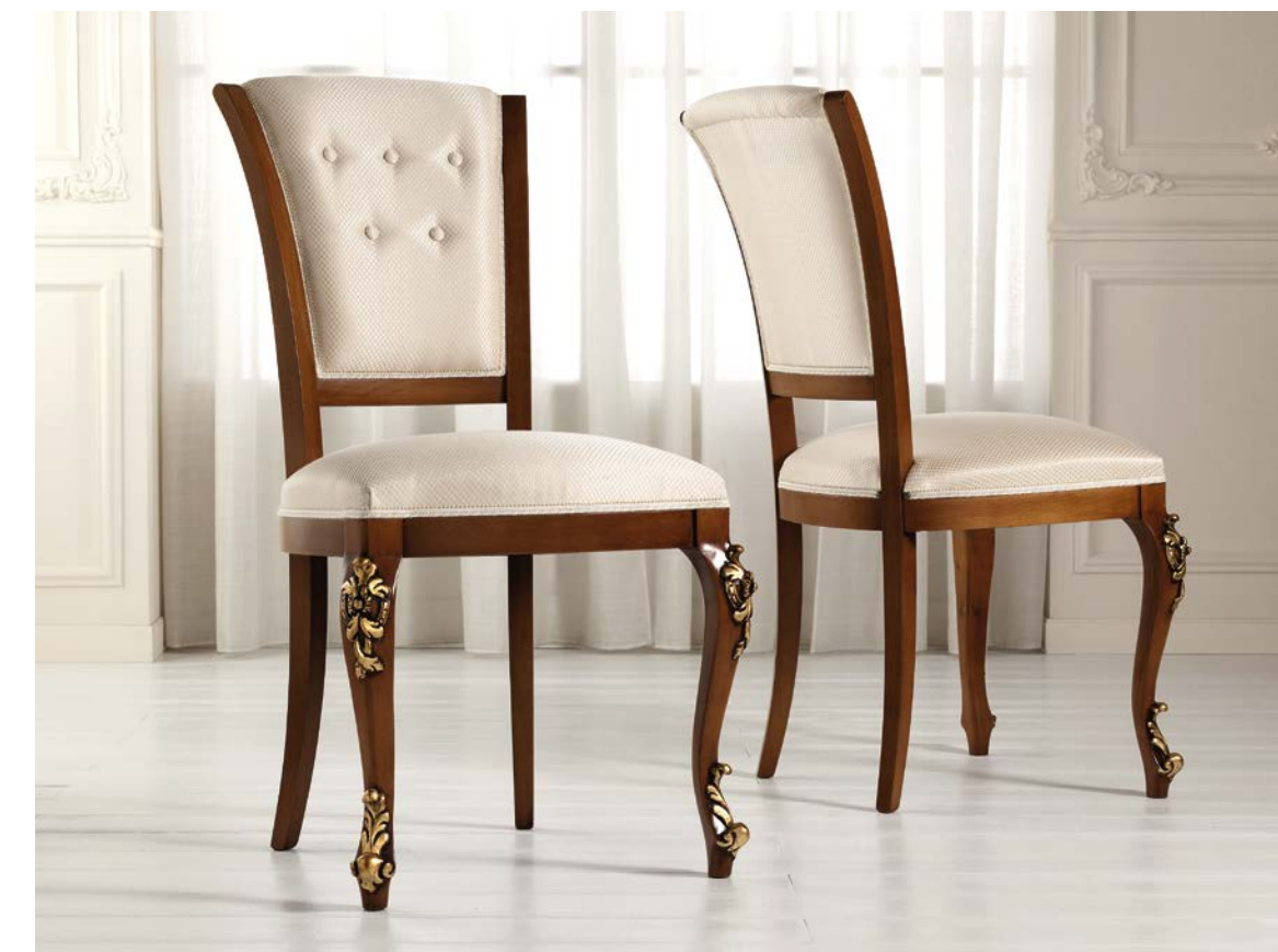
Art. 1004T - Sedia / Chair - 54x59x101H - tessuto / fabric "Siria"