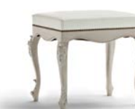
Art. 1039T Panchetta cm. 60 Bench 60 x 50 x 54H