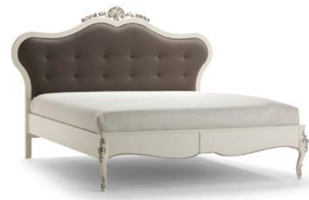
Art. 1031T Letto matrimoniale King Sized Bed 221 x 215 x 151H