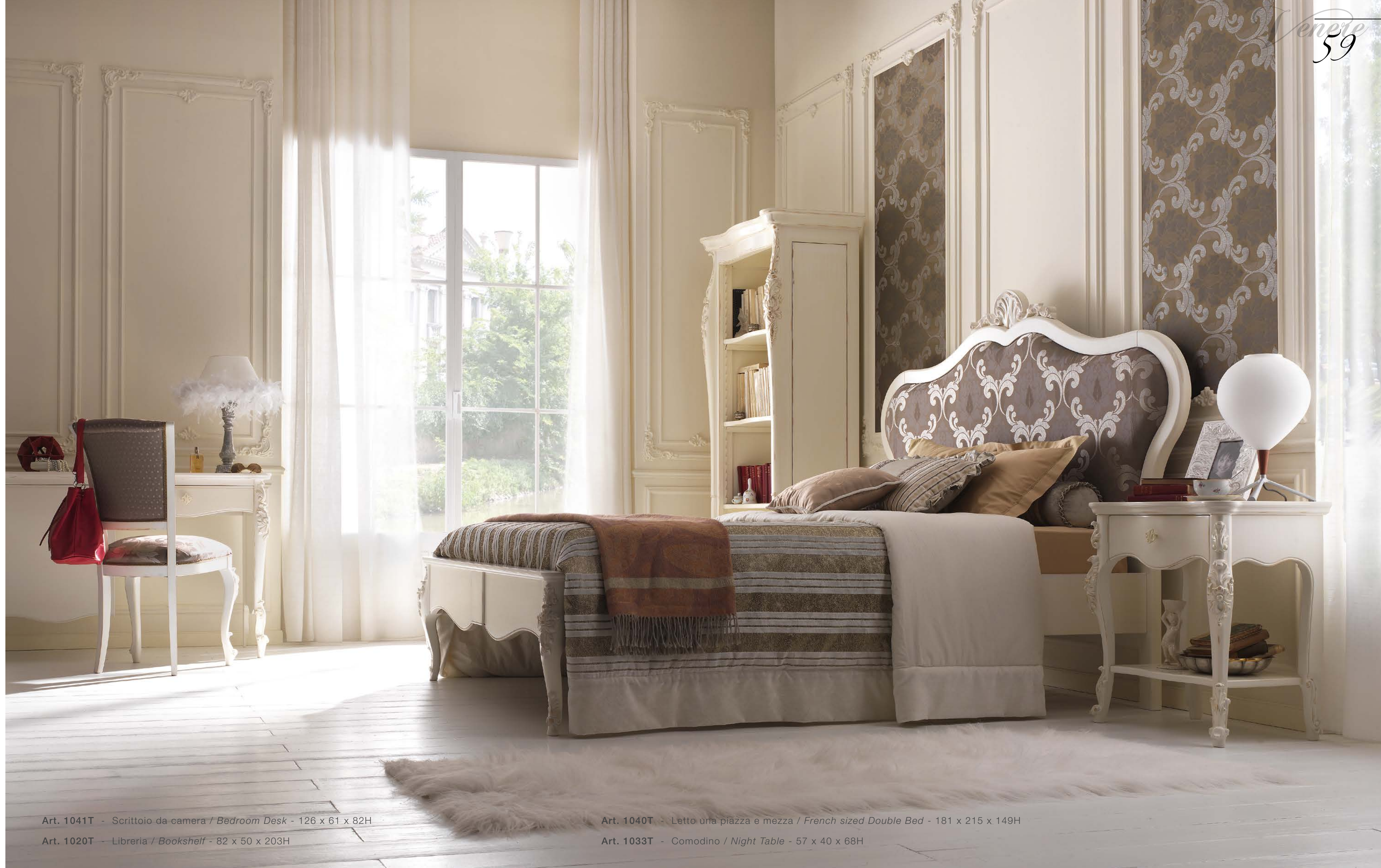
Art. 1041T - Scrivania da camera / Bedroom Desk - 126 x 61 x 82H

In the single room, the corner studio, with a small but functional desk equipped with side cabinet with one door compartment and a drawer.