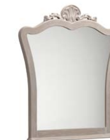
Art. 1015T Specchiera Mirror 96 x 6 x 113H