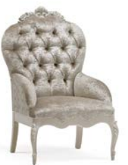
Art. 1065T Poltroncina Arm-chair 65 x 69 x 104H