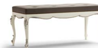
Art. 1034T Panchetta cm. 130 Bench 130 x 50 x 55H