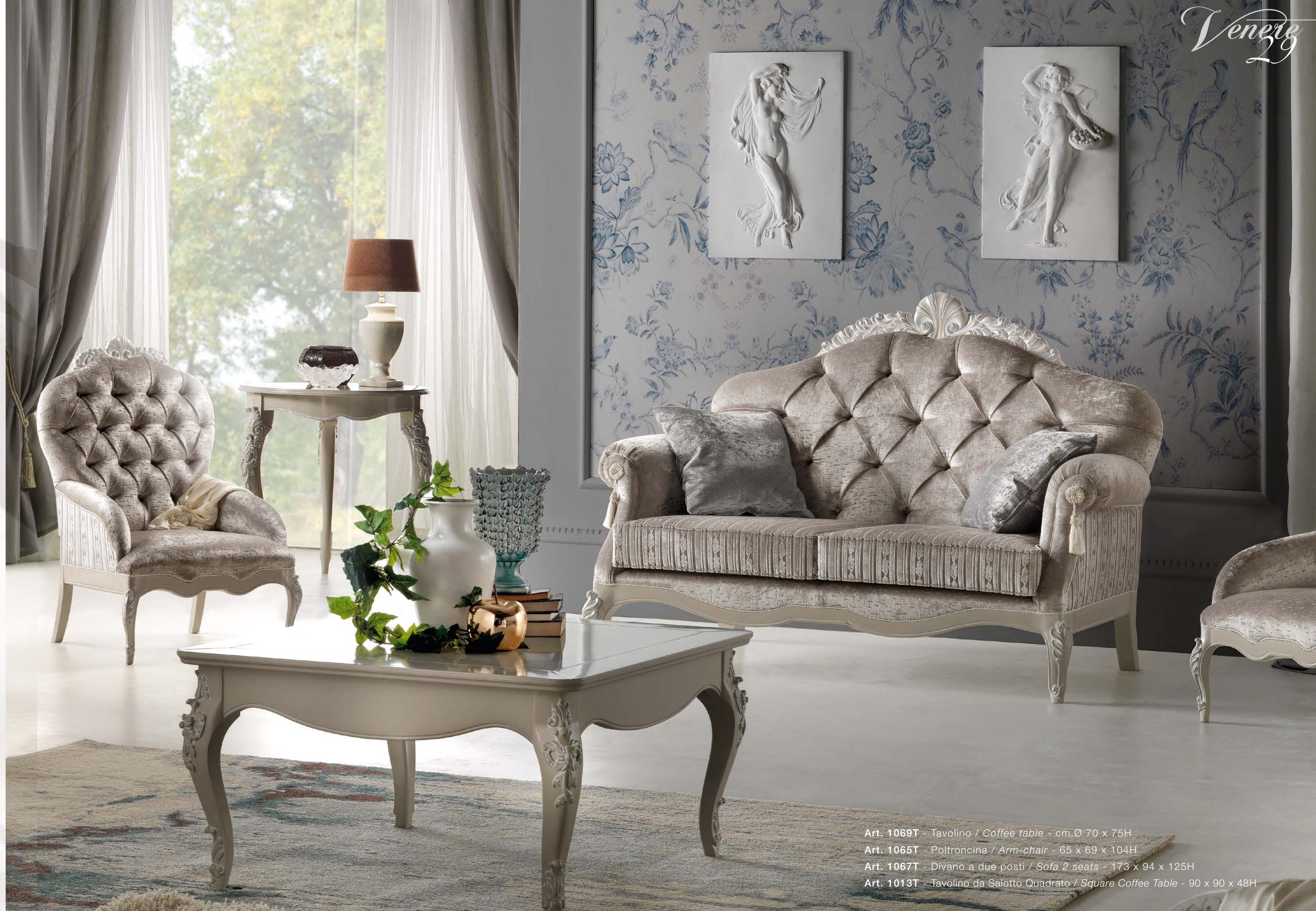
Art. 1069T - Tavolino / Coffee table - cm.Ø 70 x 75H Art. 1065T - Poltroncina / Arm-chair - 65 x 69 x 104H Art. 1067T - Divano a due posti / Sofa 2 seats - 173 x 94 x 125H Art. 1013T - Tavolino da Salotto Quadrato / Square Coffee Table - 90 x 90 x 48H