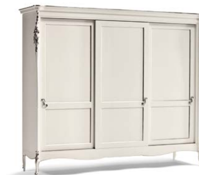
Art. 1035T Armadio 3 ante scorrevoli Sliding 3-Door Wardrobe 260 x 69 x 225H