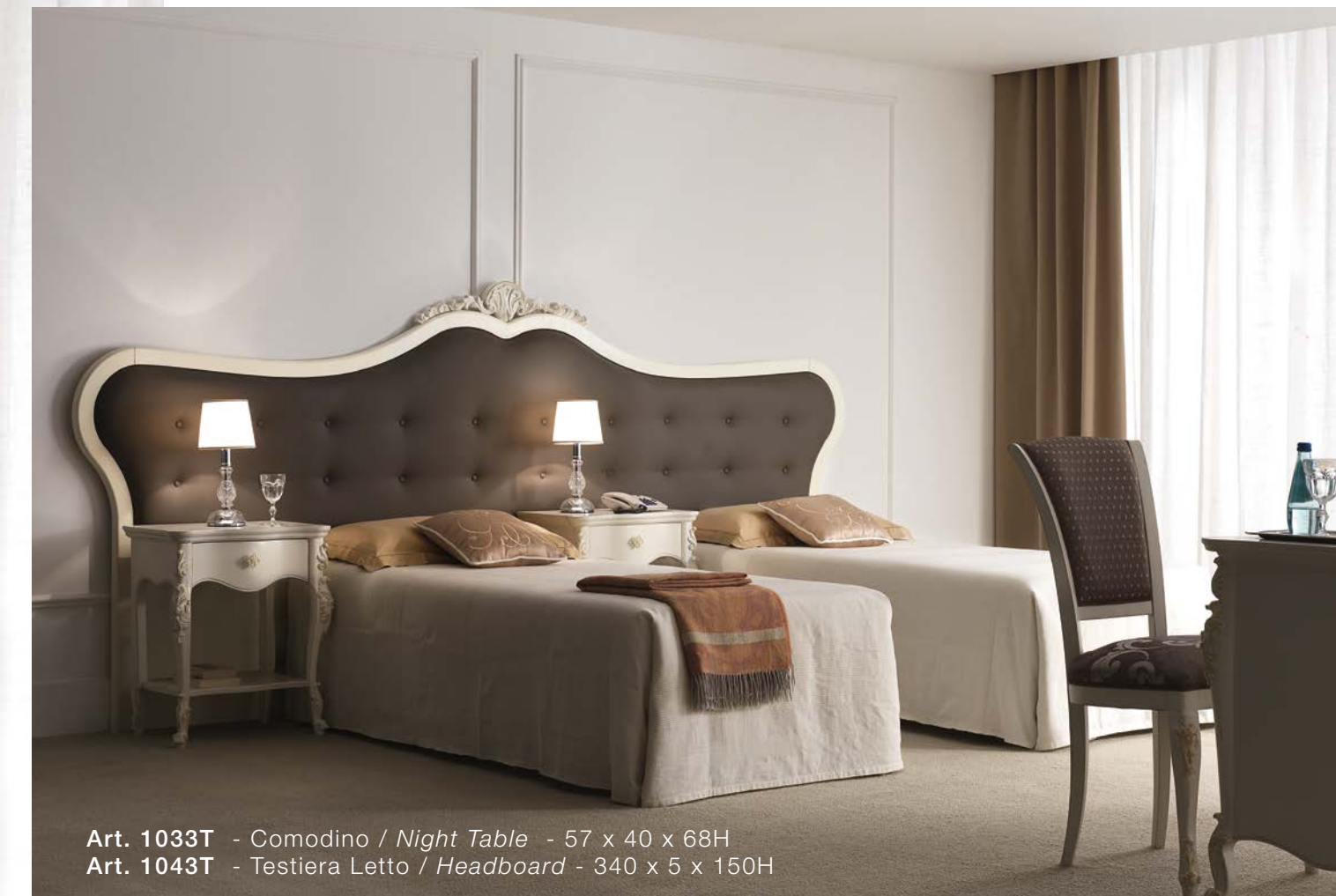
Art. 1033T - Comodino / Night Table - 57 x 40 x 68H Art. 1043T - Testiera Letto / Headboard - 340 x 5 x 150H

La testata capitonn  di grandi dimensioni studiata espressamente per il contract permette di avere la soluzione matrimoniale o quella a letti singoli.