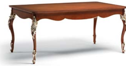
Art. 1003T Tavolo con 2 allunghe da cm. 39 Table with 2 extensions cm. 39 201 x 101 x 81H