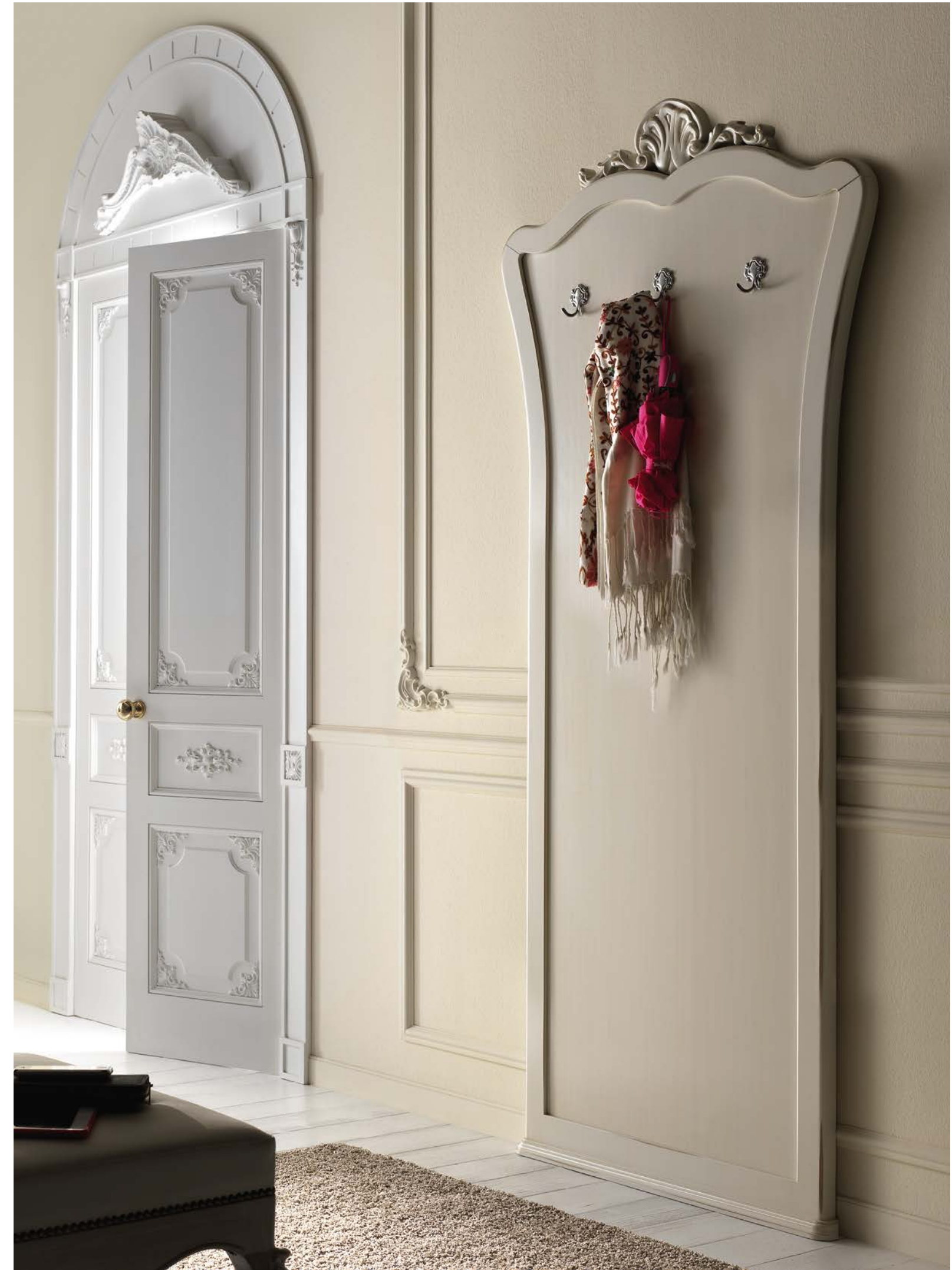
Art. 1016T - Pannello da ingresso / Clothes Hanger Panel - 96 x 6 x 207H