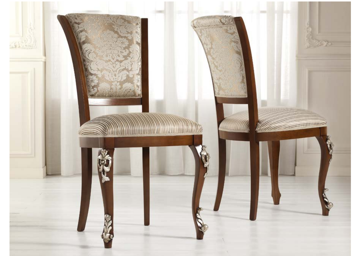
Art. 1004T - Sedia / Chair - 54 x 59 x 101H - tessuto / fabric "Vienna"