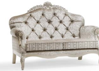
Art. 1067T Divano a due posti Sofa 2 seats 173 x 94 x 125H