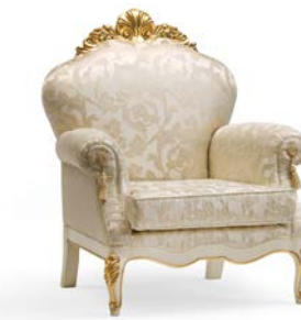
Art. 1066T Poltrona Arm-chair 93 x 84 x 120H