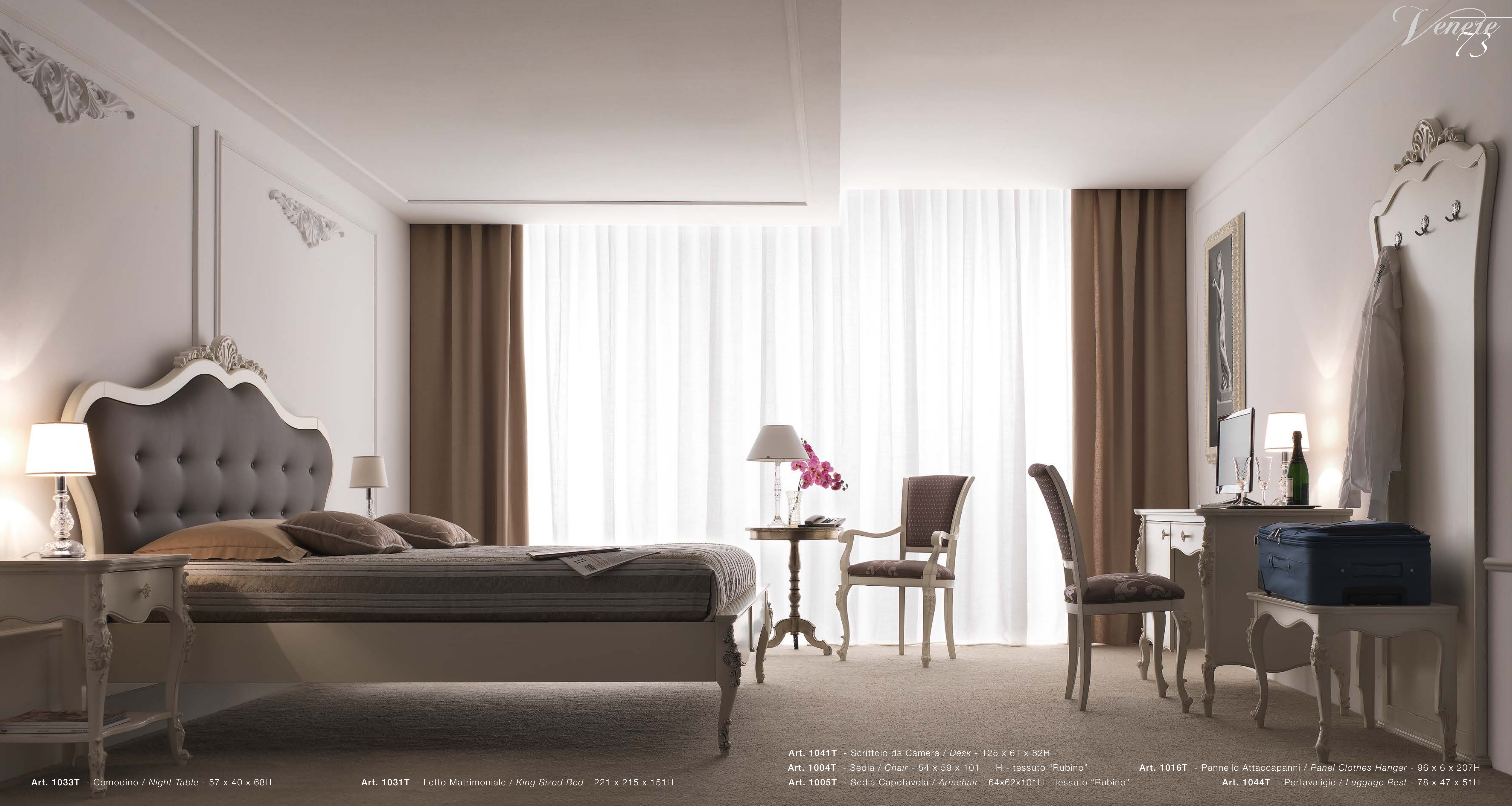
Art. 1033T - Comodino / Night Table - 57 x 40 x 68H