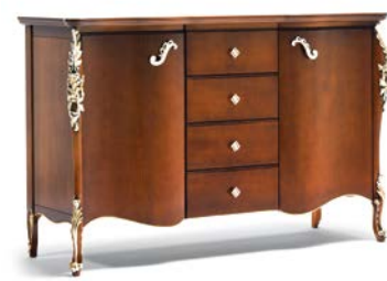
Art. 1001T Credenza Sideboard 170 x 57 x 110H