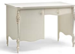
Art. 1041T Scrittoio da camera Bedroom Desk 125 x 61 x 82H