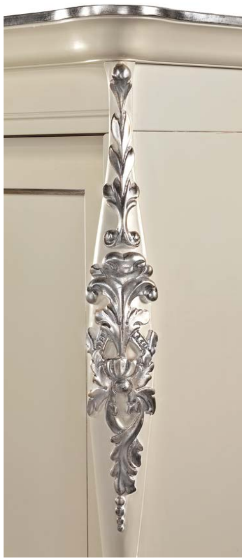
Burro + foglia argento