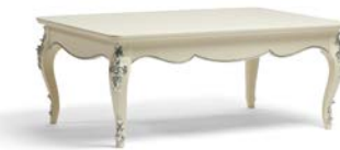
Art. 1022T Tavolino da salotto rettangolare Rectangular Coffee Table 120 x 80 x 48H