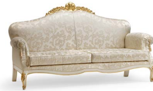
Art. 1068T Divano a tre post Sofa 3 seats 225 x 97 x 125H