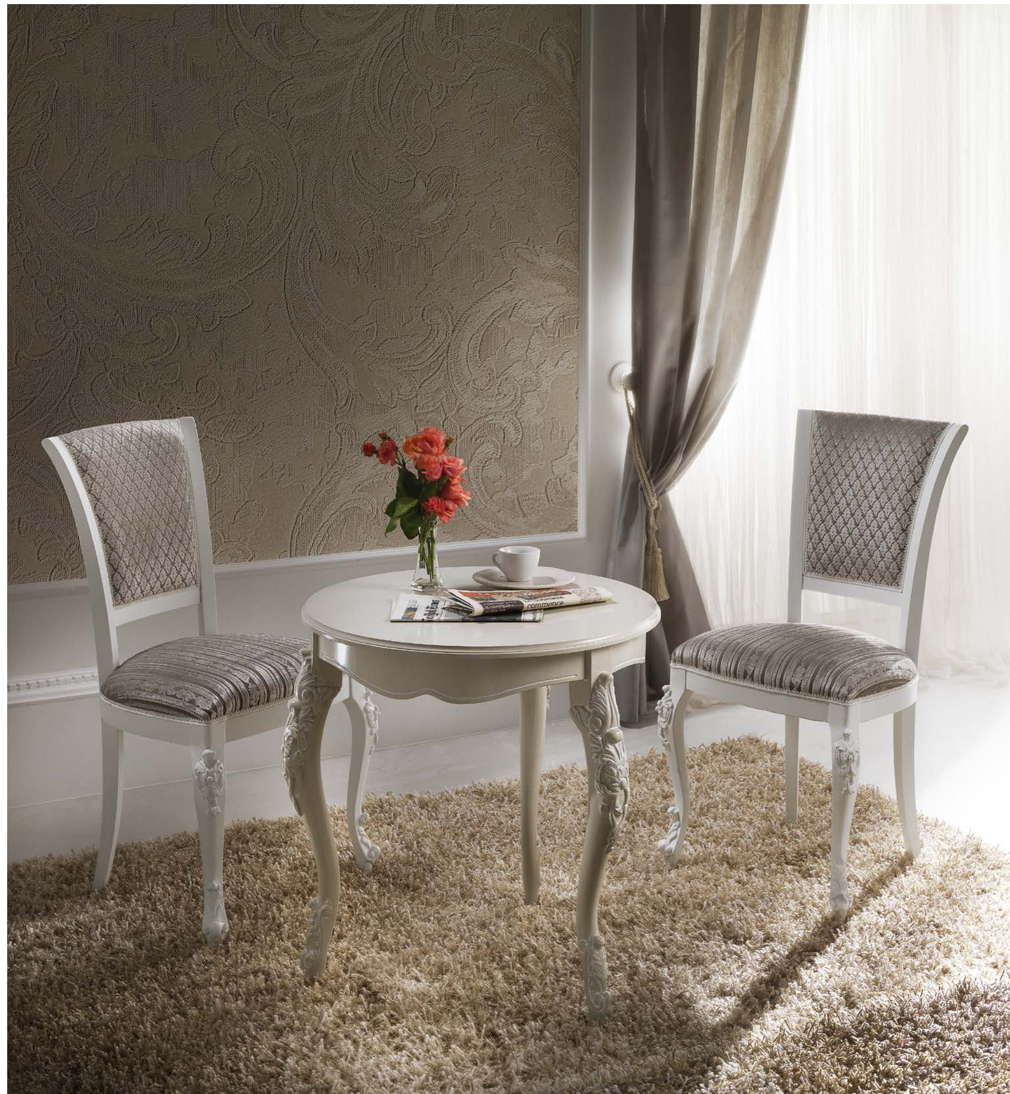
Art.1069T - Tavolino / Coffee table - cm.Ø 70 x 75H