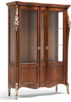
Art. 1002T Vetrina 2 porte 2 doors Display Cabinet 145 x 50 x 203H