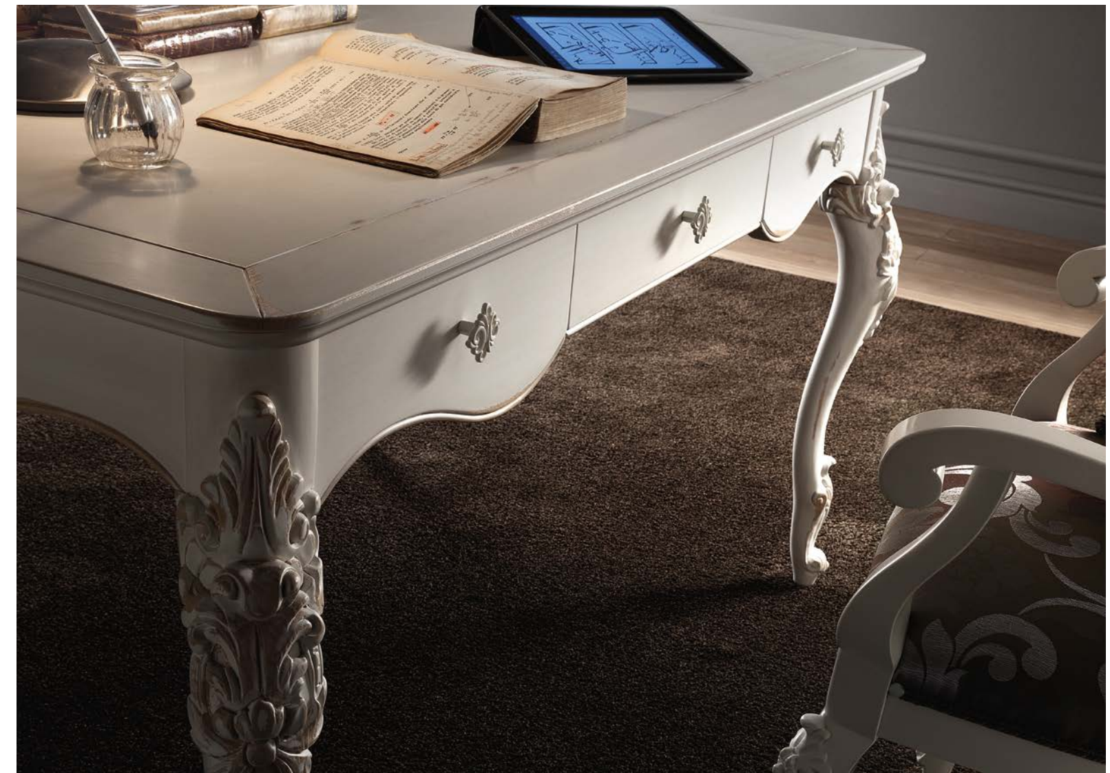
Art. 1021T - Scrivania / Desk - 141 x 91 x 81H

The decapè technique gives the library, the desk and the chairs of this studio, the appearance of furniture with experiences acquired over years, almost pieces of furniture worn by the passage of time.