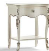
Art. 1033T Comodino Night Table 57 x 40 x 68H