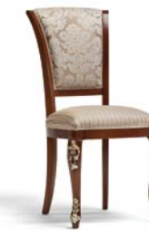
Art. 1004T Sedia Chair 54 x 59 x 101H tessuto "Vienna" fabric "Vienna"