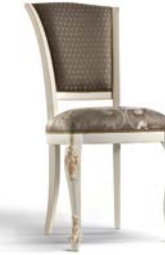
Art. 1004T Sedia Chair 54 x 59 x 101H tessuto "Rubino" fabric "Rubino"