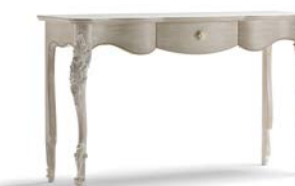
Art. 1014T Consolle Console 142 x 46 x 83H