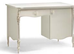
Art. 1045T Scrittoio da camera Bedroom Desk 125 x 61 x 82H