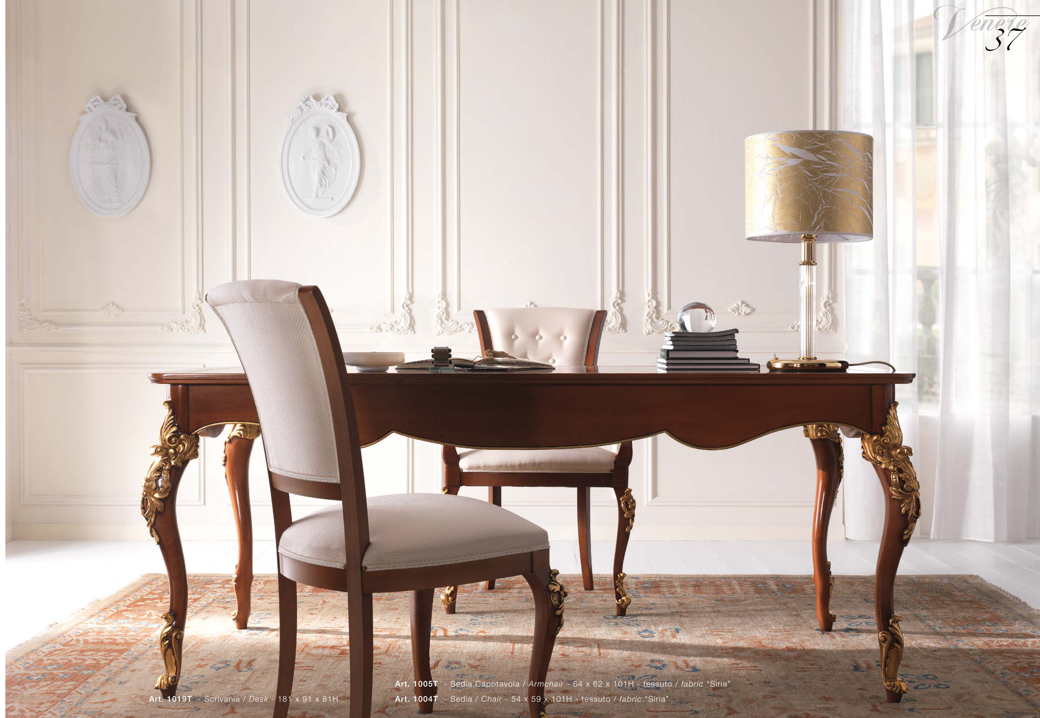
Art. 1019T - Scrivania / Desk - 181 x 91 x 81H

Practicality, functionality, tradition and history in the classic and elegant studio; and above all very current.