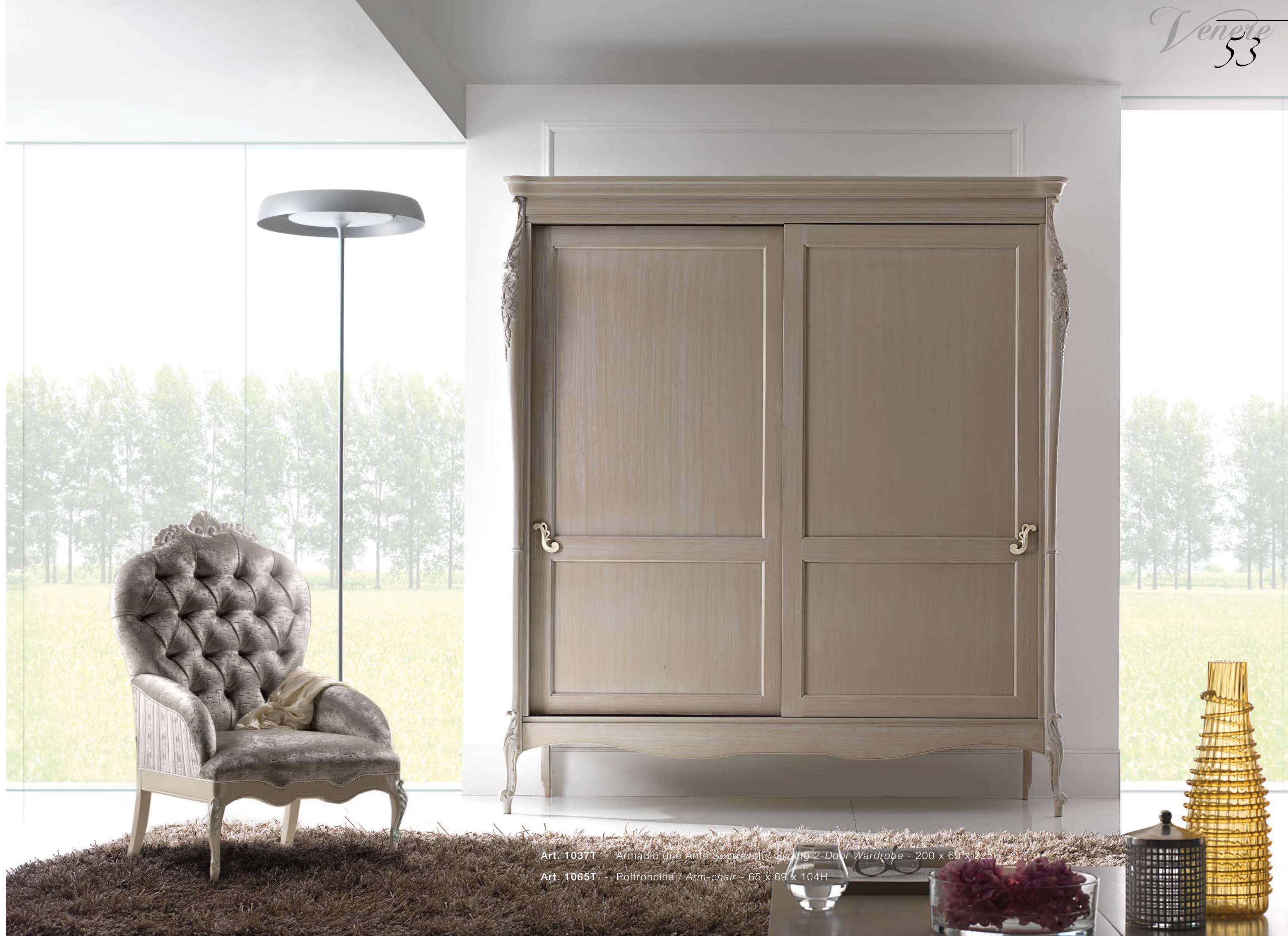
Art. 1037T - Armadio due Ante Scoprivoli - Sliding 2-Door Wardrobe - 200 x 69 x 223h