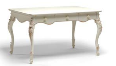
Art. 1021T Scrivania Desk 141 x 91 x 81H