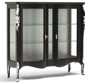
Art. 1012T Vetrinetta 2 porte 2 doors Display Cabinet 141 x 48 x 130H