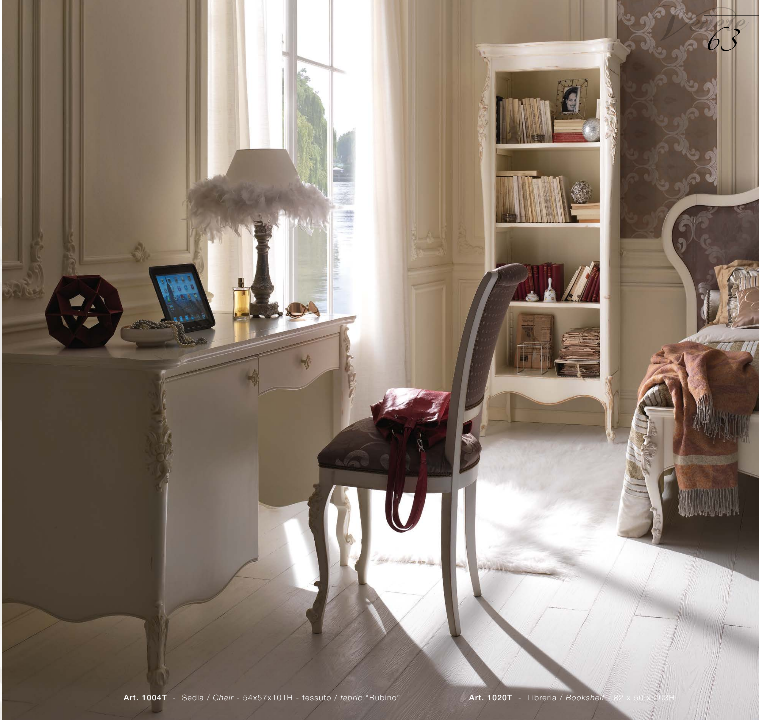
Art. 1004T - Sedia / Chair - 54x57x101H - tessuto / fabric "Rubino"