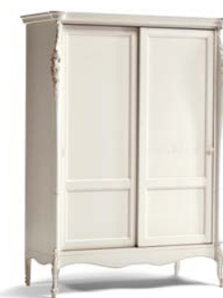
Art. 1042T Armadietto 2 ante scorrevoli Sliding 2-Door small Wardrobe 148 x 67 x 204H