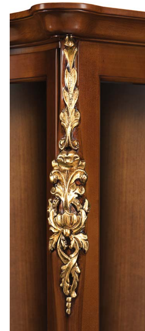
Noce + foglia oro