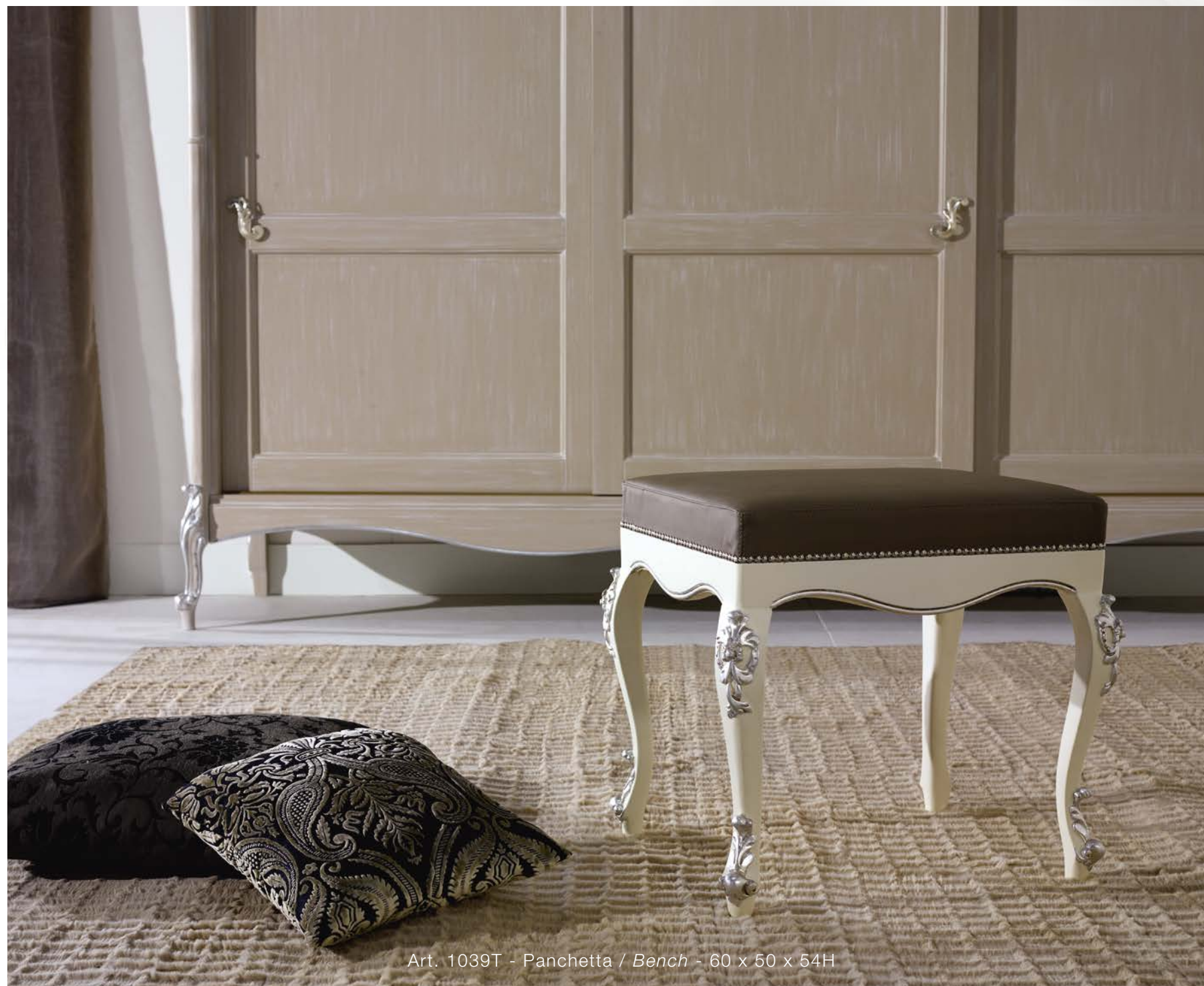
Art. 1039T - Panchetta / Bench - 60 x 50 x 54H