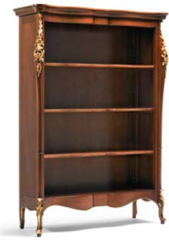
Art. 1018T Libreria Bookshelf 145 x 50 x 203H