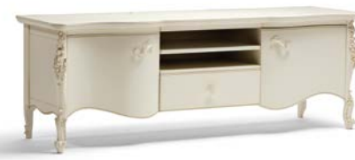
Art. 1010T Porta TV TV Stand Base 182 x 52 x 64H