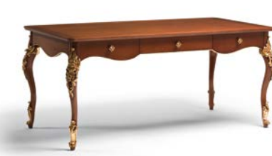
Art. 1019T Scrivania Desk 181 x 91 x 81H