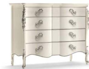
Art. 1032T Comò Chest of Drawers 137 x 57 x 110H