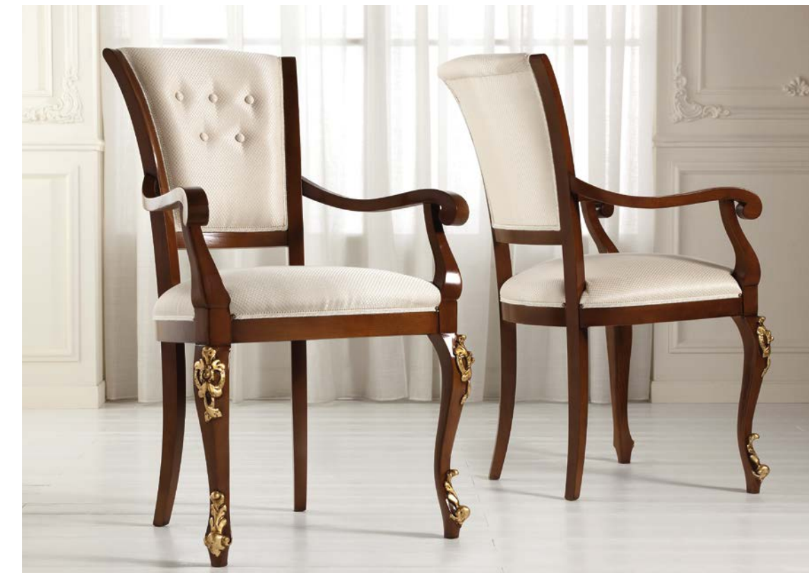
Art. 1005T - Sedia Capotavola / Armchair - 64x62x101H - tessuto/fabric "Siria"