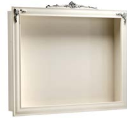
Art. 1011T Pensile Porta TV TV Framed Wall Cabinet 160 x 25 x 124H