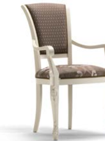
Art. 1005T Sedia Capotavola Armchair 64 x 62 x 101H tessuto "Rubino" fabric "Rubino"