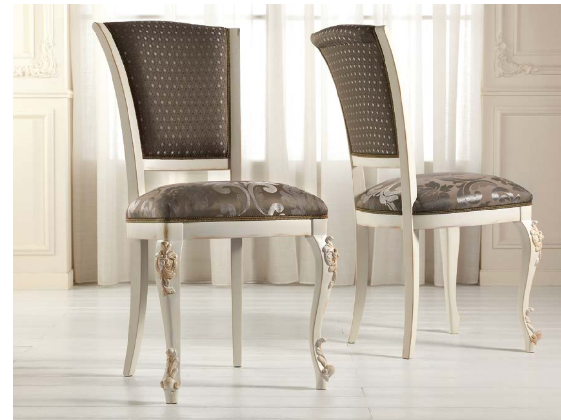
Art. 1004T - Sedia / Chair - 54 x 59 x 101H - tessuto / fabric "Rubino"