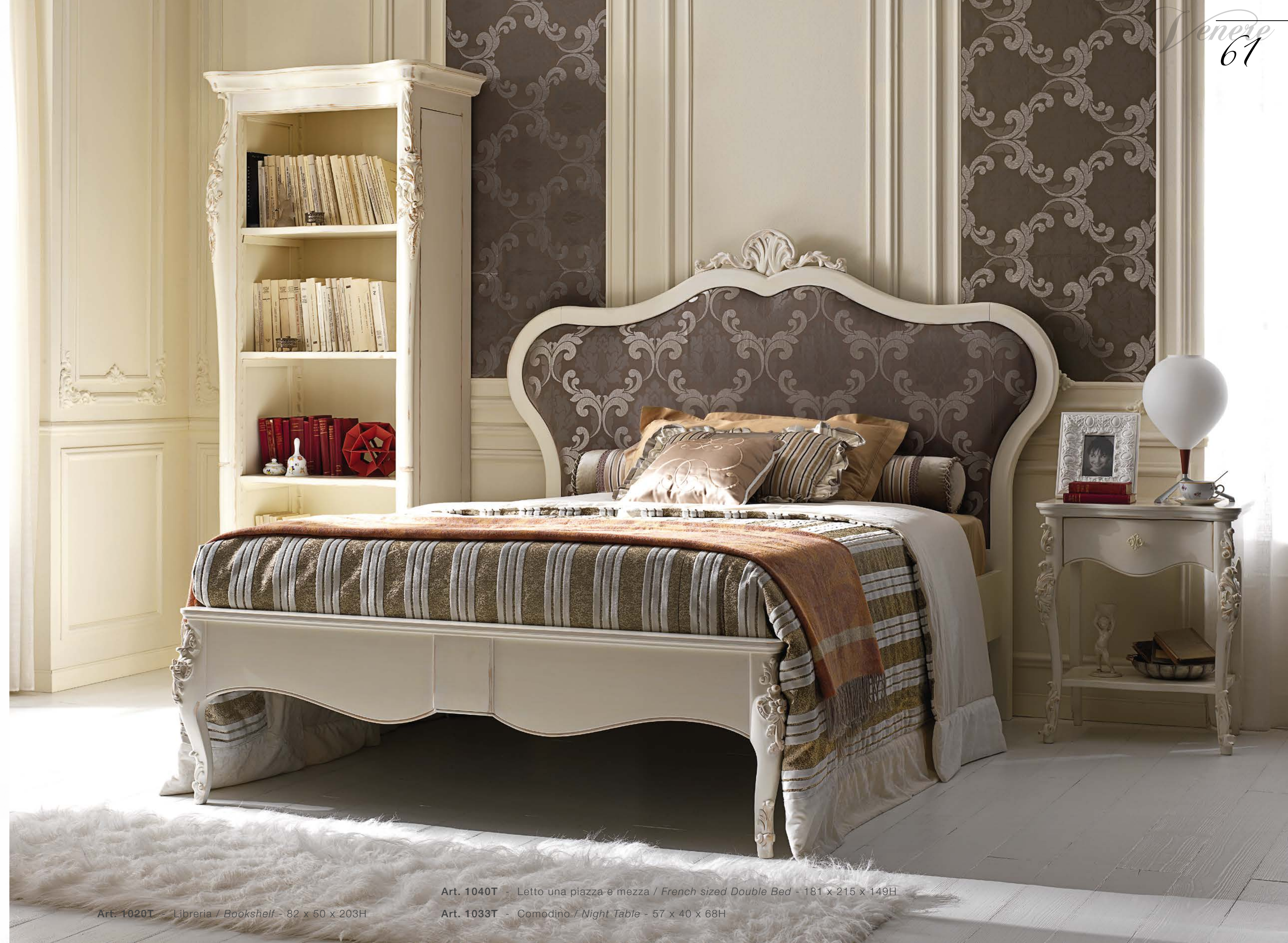
Art. 1020T - Libreria / Bookshelf - 82 x 60 x 203H

Upholstered headboard and decapè finish define a style of furniture that recalls the ancient with understated elegance, in a warm and relaxing atmosphere that makes you feel protected in a tender embrace. The French sized double bed, is more comfortable for a adult or teenager compared to a single bed, and less demanding than a normal double bed.