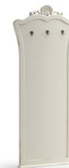
Art. 1016T Pannello da ingresso Panel Hanger 96 x 6 x 207H