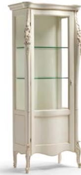
Art. 1009T Vetrina una porta sinistra One left door Display Cabinet 82 x 50 x 203H