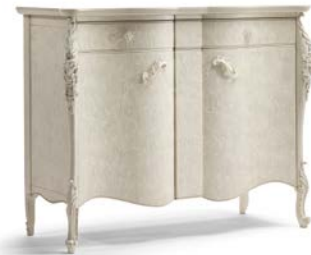
Art. 1006T Credenza Sideboard 137 x 57 x 110H