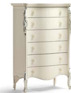
Art. 1036T Cassettiera Chest of Drawers 86 x 47 x 132H